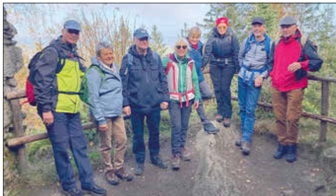
Mit lieben Menschen die Natur genießen - kann nur glücklich machen!

„Wenn man die Natur wahrhaft liebt, so findet man es überall schön.“ Vincent van Gogh