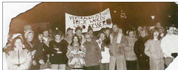
„Vertrauen ist gut – freie Wahlen sind besser!“