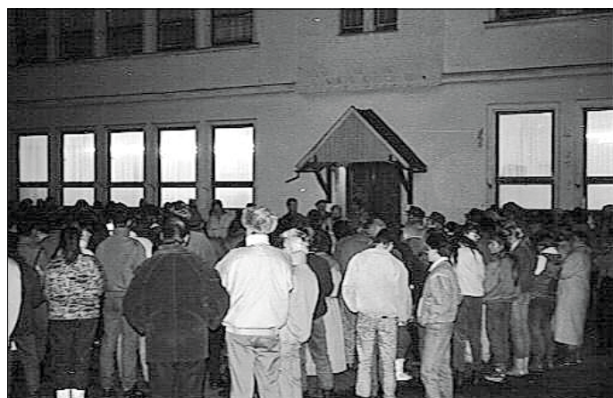
Kundgebung auf dem Schulhof

Am Abend des 4. Dezember 1989 „versammelten sich einige hundert Menschen auf dem zentralen Platz unseres Ortes.“, dem Schlossplatz.