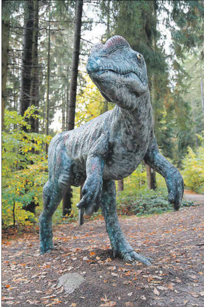
Der Liliensternus wird in den kommenden Tagen in die Werkstatt des Präparationsateliers Mandler transportiert, wo er seine Kur erhält.

Die Maßnahmen sollen noch in diesem Jahr abgeschlossen werden und alle Modelle im Jahr 2023 wieder an ihren angestammten Plätzen stehen.