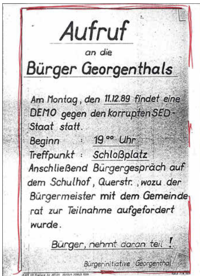
Aufruf zur Montagsdemonstration