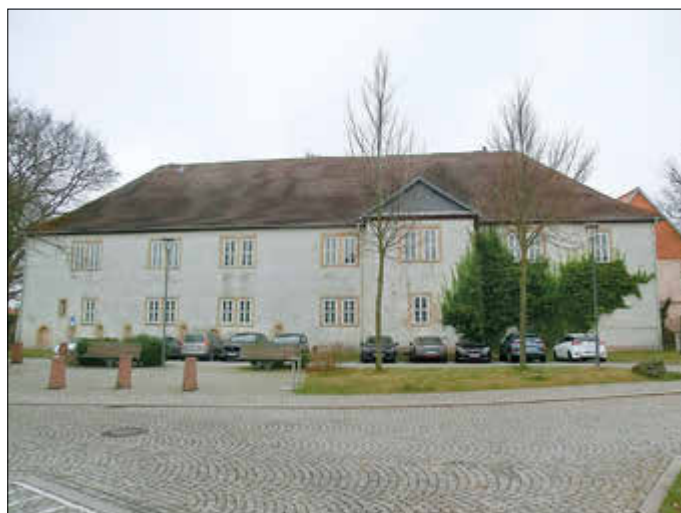
Schloss Georgenthal, Vorderfront (Westseite), 2022

Im 19. Jahrhundert war im Gebäude die herzogliche Verwaltung der umliegenden Landgemeinden untergebracht. Die unteren Räume standen dem Amtsgericht sowie dem Rent- und Steueramt zur Verfügung. Der Südflügel des Schlosses, das sogenannte Amtshaus, wurde zwischen 1870 und 1890 als Postamt benutzt. Seit 1931 dient die Schlossanlage als Pflegeheim. Die ersten Belegungen kamen mehrheitlich aus dem aufgelösten Siechenhof Ohrdruf. Zu DDR-Zeiten unterstand das Pflegeheim der Zentralen Heimverwaltung Gotha. Zurzeit steht das Schloss leer.