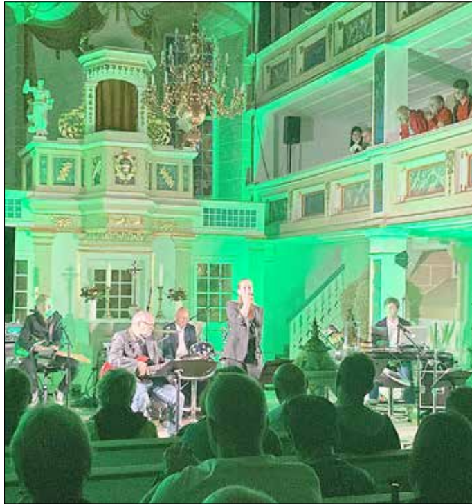
Project Unplugged 2021 in Gräfenhain