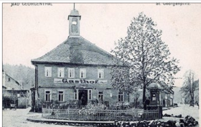
Ehemaliger Schlenk'scher Gasthof, um 1900