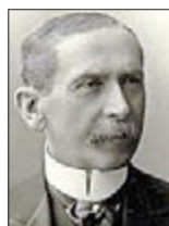
Carl von Schlenk-Barnsdorf, 1911

Um die Bronzepulverproduktion zu steigern, entstand 1888 auf dem Werksgelände eine neue und moderne Fabrikanlage. Damals machte gerade ein neue Werkstoff von sich reden, das Aluminium. Das Metall zeichnete sich durch eine hohe spezifische Festigkeit bei gleichzeitig geringem Volumen aus und war durch seine besonderen Eigenschaften ein idealer Rohstoff für die aufstrebende deutsche Industrie. Carl August Schlenk erkannte die Zeichen der Zeit und war 1892 in der Lage, zwei weitere ehrgeizige Projekte zu verwirklichen, eine Aluminium-Schlagerei und eine Aluminium-Fabrik. 1895 konnten 10.000 Pfund Feinmetall und 10.000 Pfund Bronzefarbe pro Woche hergestellt werden. Die Hauptabsatzgebiete waren Amerika, Deutschland, England, Russland, Österreich/Ungarn, Italien, Frankreich, Japan und Ostindien.