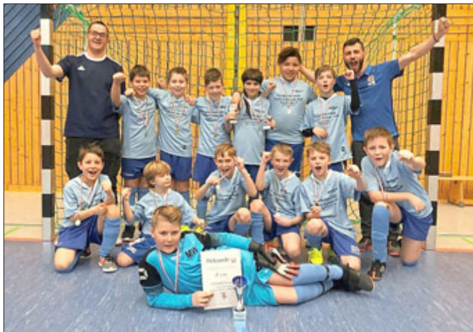
Das Siegeream der E-Junoren