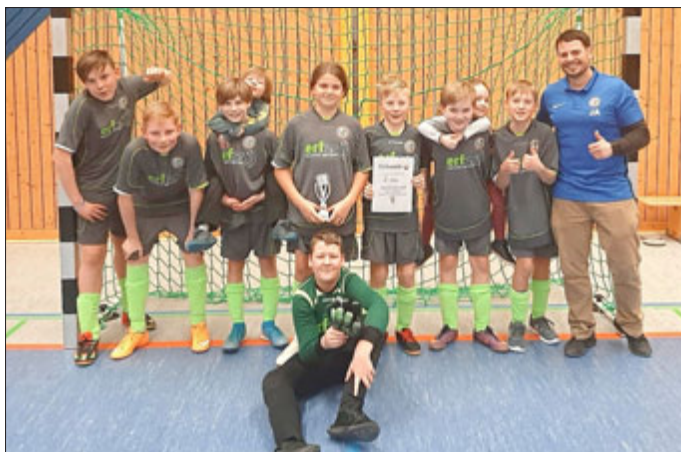
Platz 2 für unsere D-Junoren