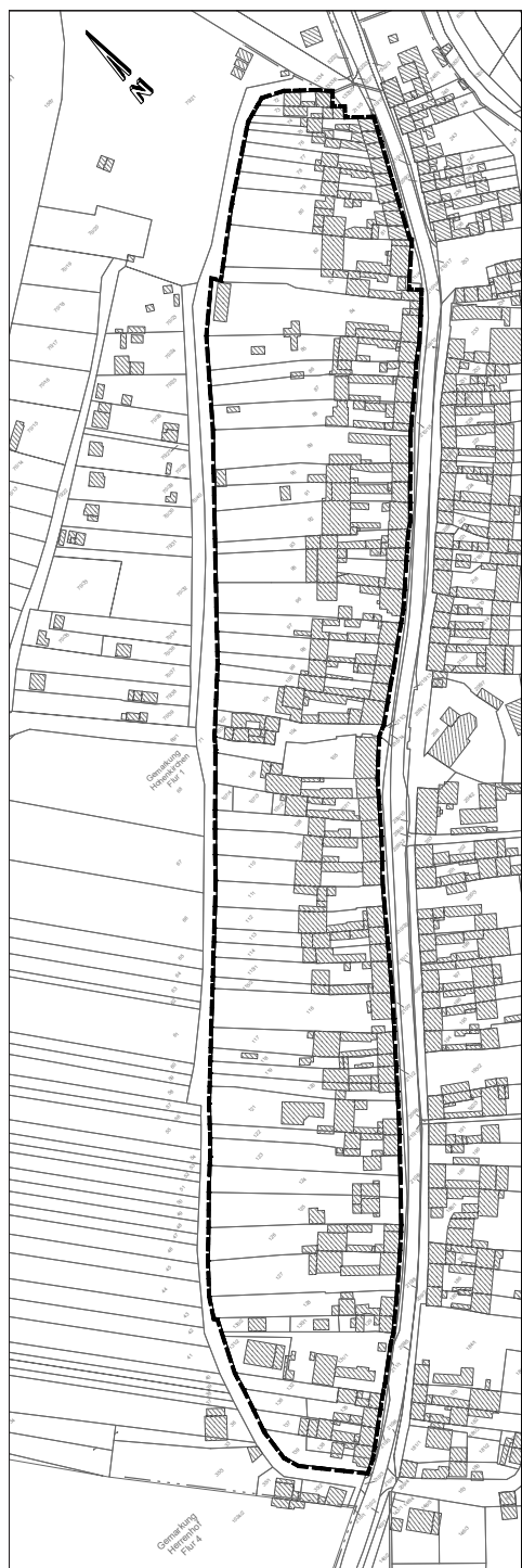
Gemeinde Georgenthal, Ortsteil Hohenkirchen – Übersichtslageplan zum Geltungsbereich des Bebauungsplans für das Gebiet „Am Riedgraben“

Anlage: Übersichtslageplan zum Geltungsbereich des Bebauungsplanes