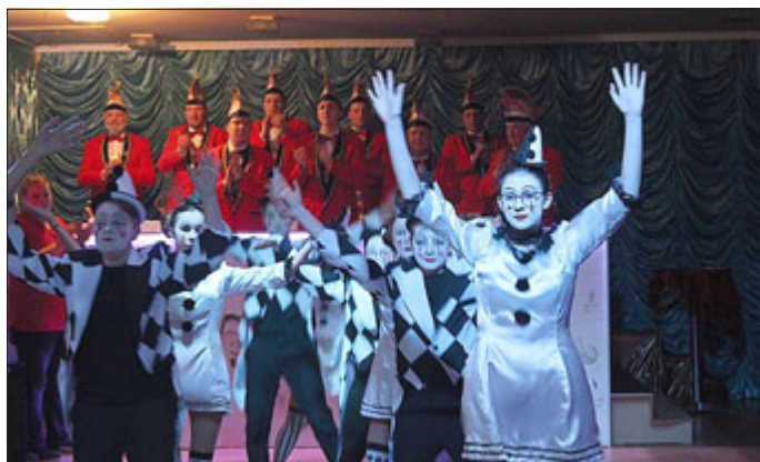
Die Teens - Harlekin's

Wir freuen uns besonders, eine Vielzahl von Kindern und Jugendlichen zu unseren Mitgliedern zählen zu können. Sie sind in verschiedenen Tanzgruppen, aber auch als Büttenrednerinnen aktiv.