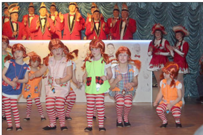
Die Minis - als Pipi Langstrumf

Wir freuen uns besonders, eine Vielzahl von Kindern und Jugendlichen zu unseren Mitgliedern zählen zu können. Sie sind in verschiedenen Tanzgruppen, aber auch als Büttenrednerinnen aktiv.