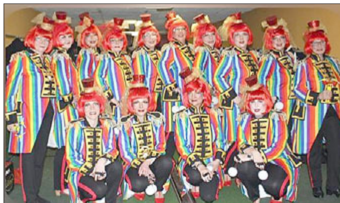
Regenbogenfarben – Der Weiberelferrat

Dieses Jubiläum wurde gebührend und farbenfroh gefeiert. Der Weiberelferrat hatte sich für farbenfrohe Kostüme in „Regenbogenfarben“ entschieden und dies gleich musikalisch aufgegriffen.