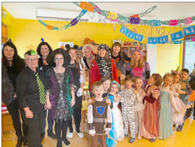
„Villa Kunterbunt“ Schönau v. d. Walde