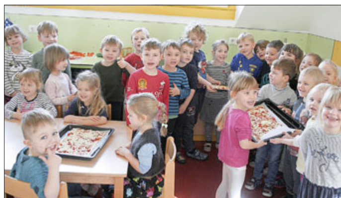
Es hat allen sehr gut geschmeckt!

legt und im Ofen waren, konnten es die Kinder kaum abwarten diese zu essen.